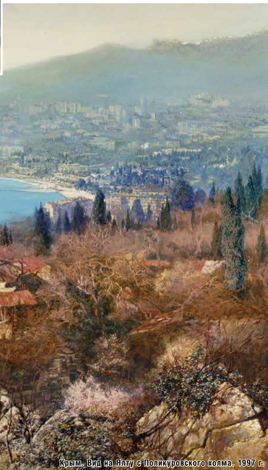
Крым. Вид на Ялту с Поликуровского холма. 1997 г.